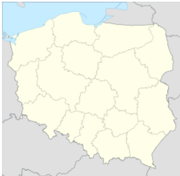
Położenie Bierawy na mapie Polski

Miejscowość zamieszkuje 1339 osób. Bierawa jest wsią przemysłowo - rolniczą. Jej mieszkańcy znajdują zatrudnienie głównie w Zakładach Azotowych Kędzierzyn S.A z uwagi na ich bliskie sąsiedztwo oraz w zakładach na terenie gminy, jak: SpotLight, Britop, Cemex. Działający na terenie sołectwa Dom Kultury prowadzi różnorodne formy upowszechniania kultury. Przez Bierawę przechodzą dwie drogi wojewódzkie: 408 i 425. Bierawa leży przy ważnej linii kolejowej o znaczeniu krajowym i międzynarodowym z Kędzierzyna-Koźła do Bohumina. Od 1992 r. Gmina Bierawa utrzymuje układ partnerski z gminą Ostfildern z Niemiec oraz od roku 2013 z gminą Markvartovice w Czechach.