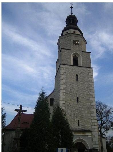
Kościół Rzymskokatolickiej Parafii PW. Trójcy Świętej