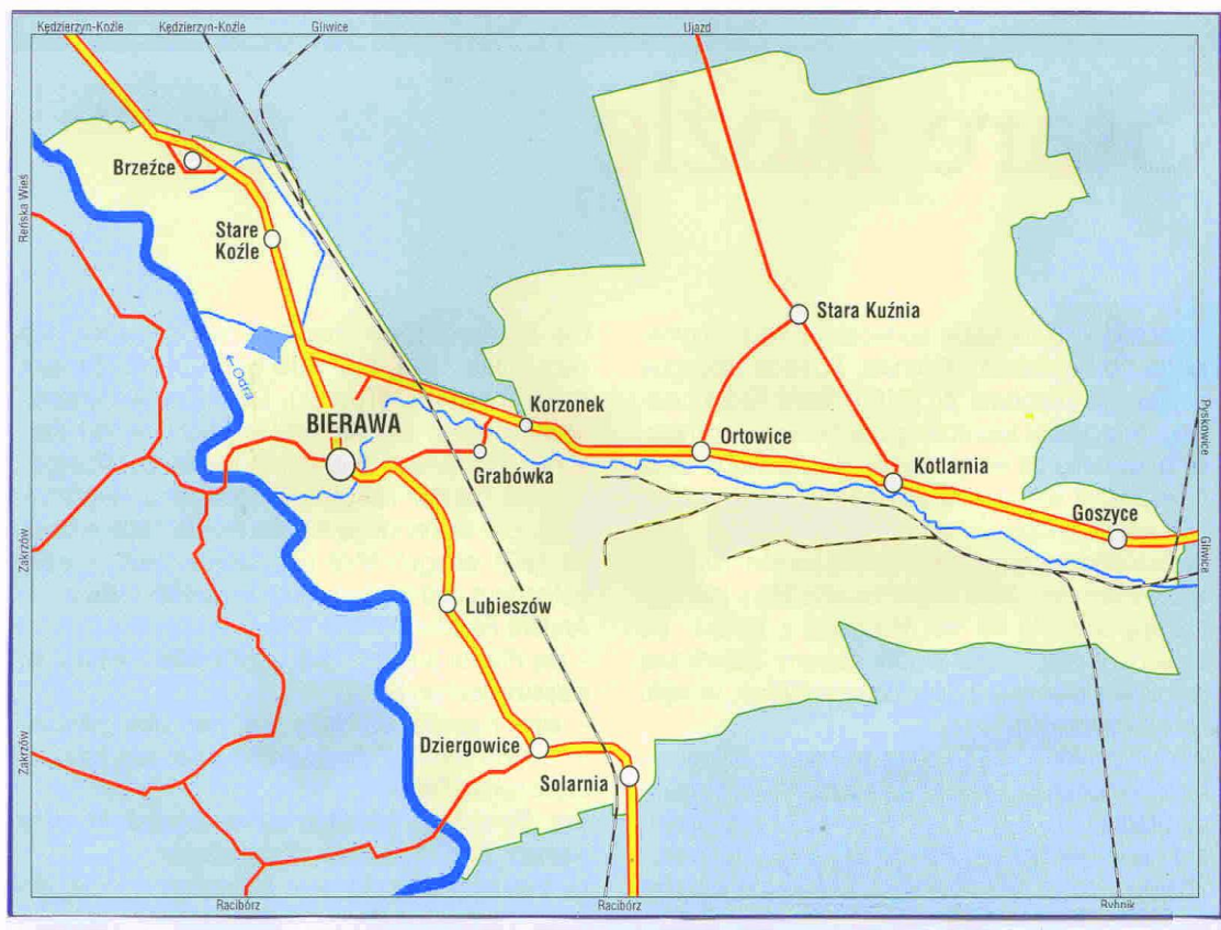
Sołectwo Bierawa na mapie Gminy Bierawa

Niniejszy plan jest dokumentem otwartym, w związku z tym może być modyfikowany w zależności od potrzeb lokalnej społeczności, finansów, uwarunkowań gospodarczych oraz innych czynników.